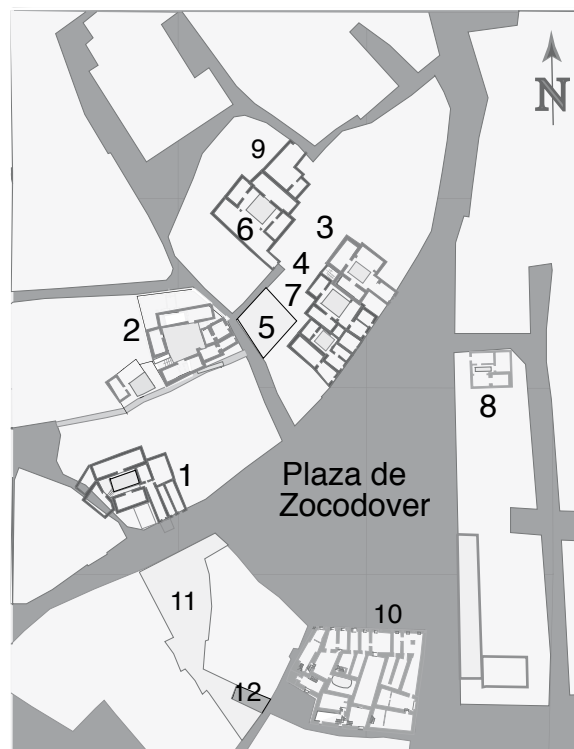
Figure 2. Les mesones dans l'aire du Zocodover au XV e siècle 1: Mesón de los Paños, 2: Mesón de la Sillería, 3: Mesón AA-2, 4: Mesón, 5: Mesón Pintado, 6: Mesón de la Cadena, 7: Mesón de la Madera, 8: Mesón de San Cristóbal, 9: Bodega, 10 : Îlot sud de la "plaza del Zocodover", 11: Mesón de las Sogas, 12: Mesón de la Foga

Les mesones sans patio occupent des superficies au sol comprises entre 14 et 35 m 2 , et présentent au rez-de-chaussée de une à trois pièces du type portal ou casa puerta . Un niveau de chambres ou de soberados se superpose souvent aux pièces du rez-de-