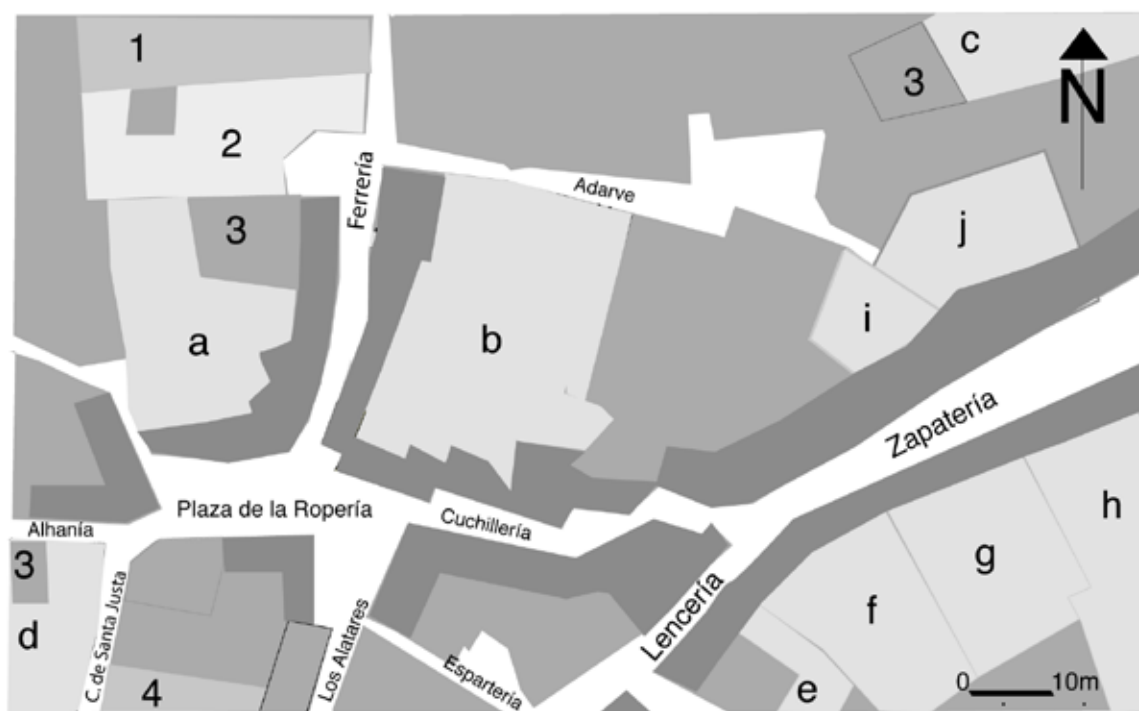
Figure 5. - Les “mesones” au voisinage de l’église de San Nicolas à la fin du XV e siècle

1: Eglise de San Nicolas, 2: Corral ou Cloître de San Nicolas, 3: Four à pain, 4: Eglise de Santa Justa Les “mesones” : a: Meson de las Muelas, b: Meson del Carbón y del Hierro, c: Meson de la Sillería, d: Meson del Lino, e: Meson de la Pez, f: Meson de La Calahorra, g: Odrería, h: Meson de las Sogas, i: Meson del Sedadero, j: Meson de los Paños