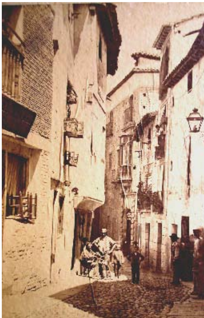
Calle de las Cadenas (anciennement Ferrería)

Torres Balbas, L. (1982), Obra dispersa I. Al-Andalus, Cronica de la España Musulmana (vol. 3), Madrid, pp. 220-266.